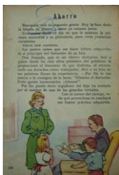
Dastugue María (1955) El tambor de Tacuarí. Libro de lectura para tercer grado , Buenos Aires, Editorial Luis Lasserre, p. 118