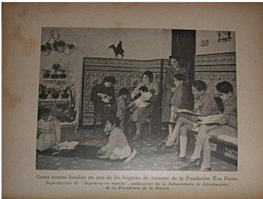
Cozzani de Gilloni, G. R. (1953) Mensaje de Luz. Libro de lectura para tercer grado , Buenos Aires, Angel Estrada y Cía editores, p. 65.